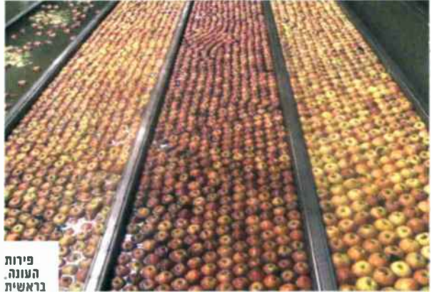
פירות העונה, בראשית