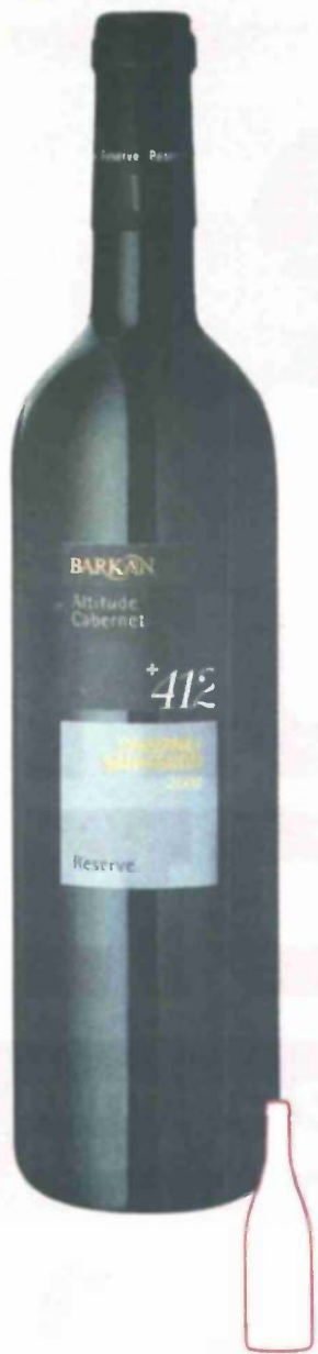
ברקן, אלטיטיוד קברנה סוביניון 2007 +412