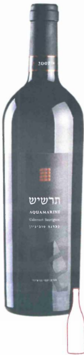
בנימינה, אבני החושן, תרשיש 2007

"תרשום שהוא כאילו נכנס עם תעורת זהות מזויפת", ביקשה ממני הילה, "הוא מתחיל כמו יין בוגה, אבל כשטועמים אותו מתברר שהוא ילד". רשמתי. "כריון אבל רגיש", הוסיף ביטון את הדימוי שלו לגבי היין. אני חשבתי שהיין מאוד מחוכך, ברור וחד־משמעי. עם ריחות של פרי בשל, פרי טרי, שוקולה, מוקה ומנטה. כולנו הרגשנו שלמרות העוצמות שלו מדובר ביין נעים ואלגנטי שמלטף את הפה בזמן שהוא ממלא אותו בתחושות וטעמים. יין טוב שיהיה עוד יותר טוב בעור שלוש שנים ויותר.