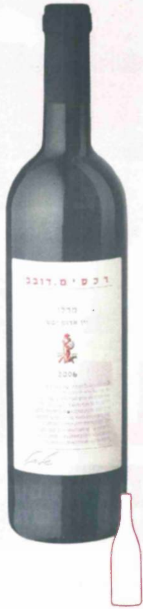
סגל, רכסים, דובב, חרלו 2006